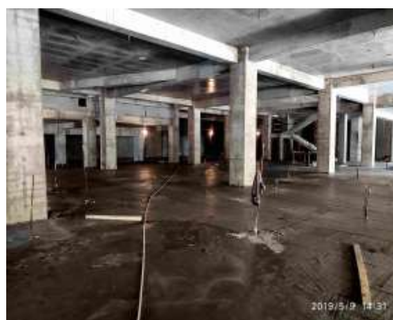
地下室地面混凝土浇筑