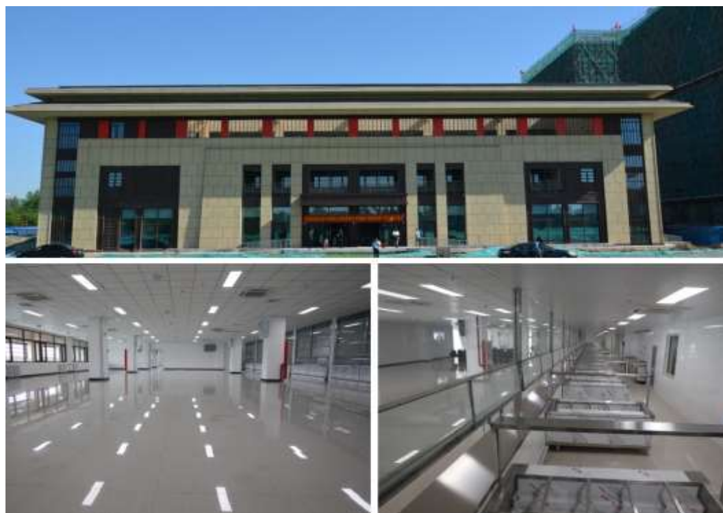
食堂外观、大厅、后厨