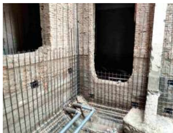
地下管线预留预埋