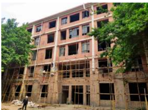
基础楼外脚手架搭设

钢筋绑扎基本完成，一层内墙加固完成，构造柱圈梁拆除基本完成，管线预留预埋施工完成；基础医学院楼主楼部分完成基础加固和回填土施工，配楼完成基础钢筋绑扎，二层完成碳纤维加固；本月计划学六楼木屋面拆除完成，结构加固完成；基础楼东西配楼回填土施工完成，东西配楼外脚手架搭设，碳纤维加固完成，管线预留预埋施工完成。