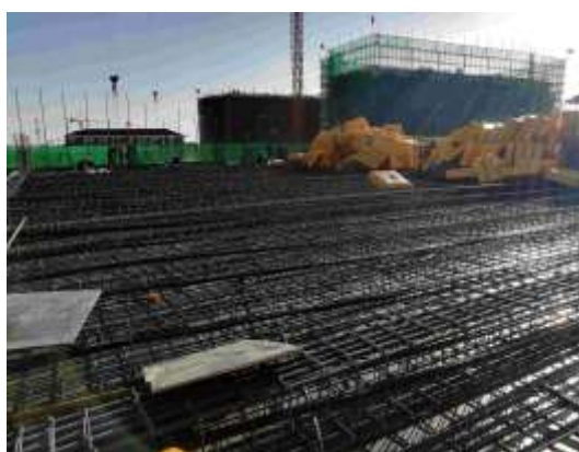
二层顶板钢筋绑扎

西院锅炉房项目 (B18): 该项目上月已完成整体二层结构施工, 下月计划完成主体封顶, 并做好春节前项目停工准备工作。