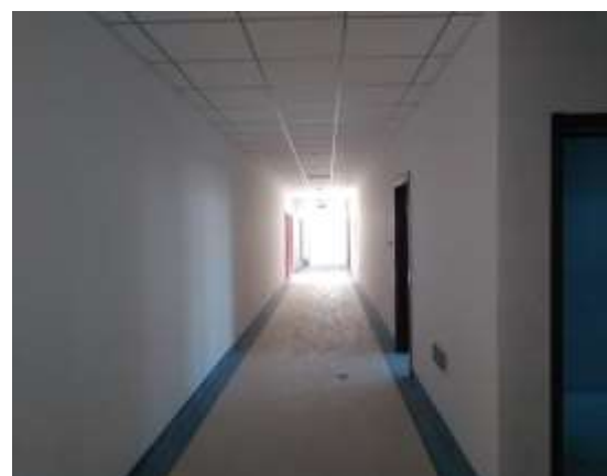
走廊吊顶安装完成

西院市政及道路管网： 该项目上月西五路步道垫层完成 50%，西六路步道铺设完成 95%，西环路步道铺砖完成 30%，西环、西五、西六路步道路缘石安装全部完成，强、弱电井，管线及路灯底座安装全部完成，管理学院、人文学院段雨水管线完成 70%，西院公共教学楼、公共教学部段雨污水管线全部完成；本月计划完成西区环路 K0+160+440 段路面平整碾压及管理学院、人文学院段西南侧给水、中水、雨水管线施工。