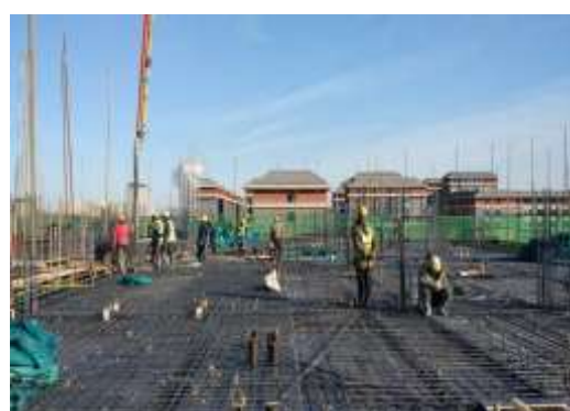
二层顶板钢筋绑扎