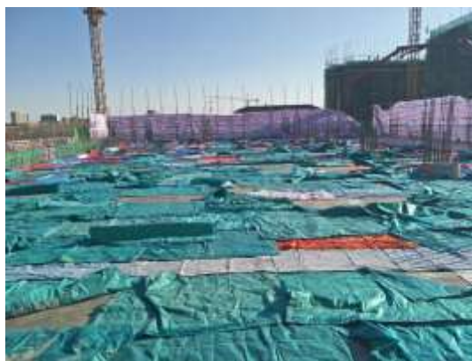
二层顶板保温覆盖